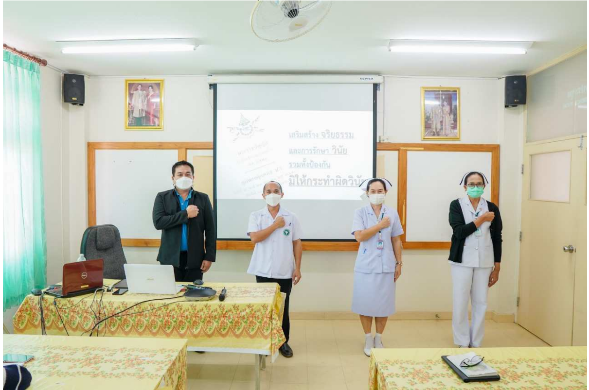
ภาพถ่าย การอบรมการเสริมสร้างจริยธรรม ป้องกันและต่อต้านการทุจริตประพฤติมิชอบและผลประโยชน์ทับซ้อน โรงพยาบาลหนองมะโมง ปี ๒๕๖๕ วันที่ ๑๓ มกราคม ๒๕๖๕ เวลา ๐๘.๓๐ น.-๑๕.๓๐ น. ณ ห้องประชุมโรงพยาบาลหนองมะโมง